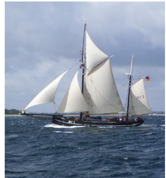
Maritimer Botschafter für Bremen